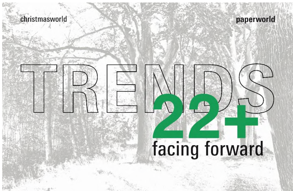
Facing Forward: Der Blick in die Zukunft mit den Trends der Christmasworld und Paperworld für 2022+

„Facing Forward“ – so lautet das Motto der Christmasworld und Paperworld Trends 2022+. Die drei gemeinsamen Trendaussagen „hearted+minimal“, „mystic+originate“ und „local+vital“ zeigen die relevanten Themen, Farben, Materialien, Inspirationen und Styles für 2022+. Sie geben dem internationalen Dekorations- und PBS-Handel Orientierung für die individuelle Sortimentszusammensetzung. Neu ist ein breiteres Farbspektrum pro Trend – für eine noch einfachere Farbkombination bei der Warenpräsentation.