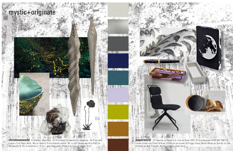
„mystic+originate“ taucht in naturnahe und doch surreale Welten ein.

„mystic+originate“ macht schöne Werte des Miteinanders und Feierlichkeiten je nach Anlass wieder erlebbar und lebendig.