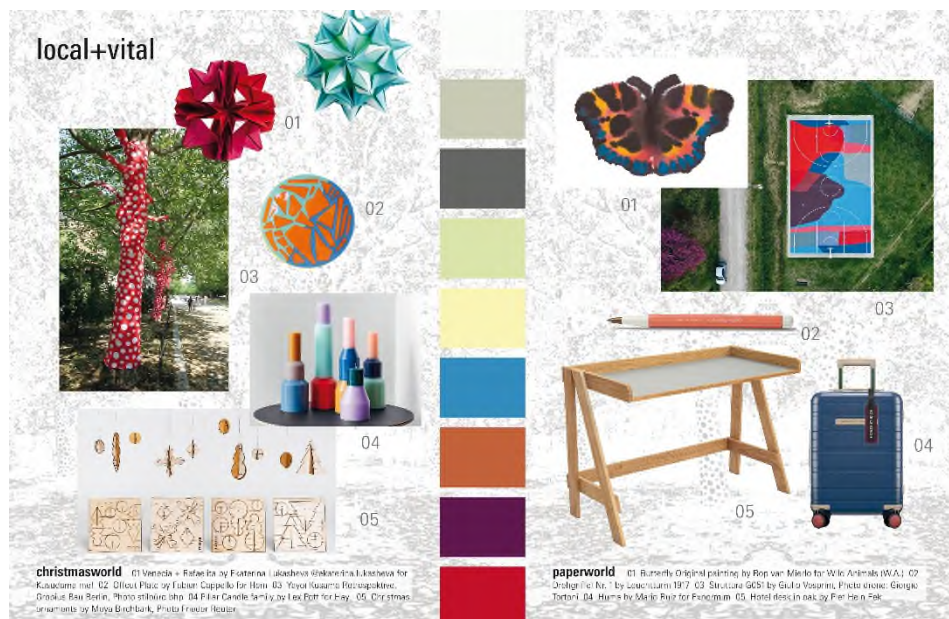
„local+vital“ bringt Fröhlichkeit durch plakative Farben und lokale Produkte.

Diese Stilwelt rückt ortsbezogene Projekte, lokale Produkte und charakteristisches Design in den Mittelpunkt. Ziel dahinter ist es, sowohl Fröhlichkeit und Kreativität zu fördern als auch eine Verbindlichkeit und Nähe zu uns lieb gewonnenen Orten zu schaffen. Die nahe Umgebung, das Stadtviertel und die unmittelbare Nachbarschaft sind wichtiger denn je. Private und öffentliche Outdoor-Flächen stellen begehrten Freiräume dar, die sich zum Zentrum des Lebens entwickeln können. Die Arbeit und viele Aktivitäten entkoppeln sich immer weiter von fest definierten Räumen. Dabei spielt DIY und Freude eine entscheidende Rolle, was als Lebensoptimismus bei Feiern und im Office mit umweltbewussten Aspekten einfließt.